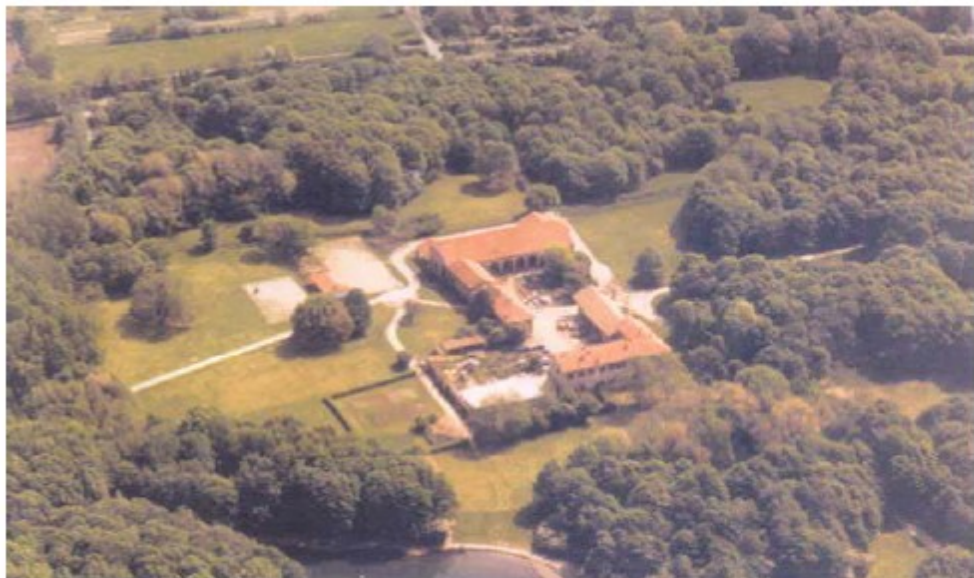
Vista aerea della Cascina San Romano tra radure ed aree trasformate a bosco. In basso si intravede il laghetto del Boscoincittà