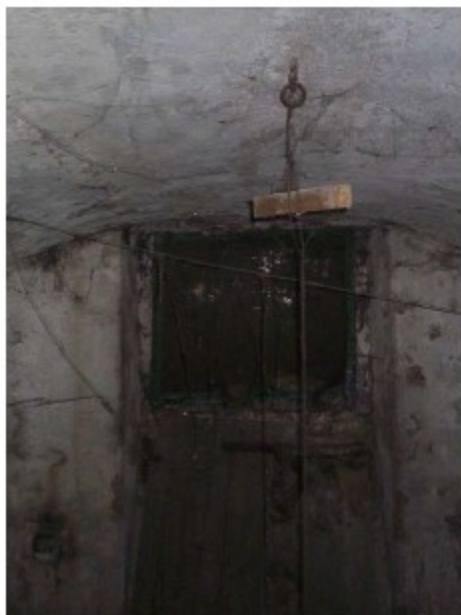
L'affresco con l'effigie della Madonna di Caravaggio e l'interno dell'antica ghiacciaia