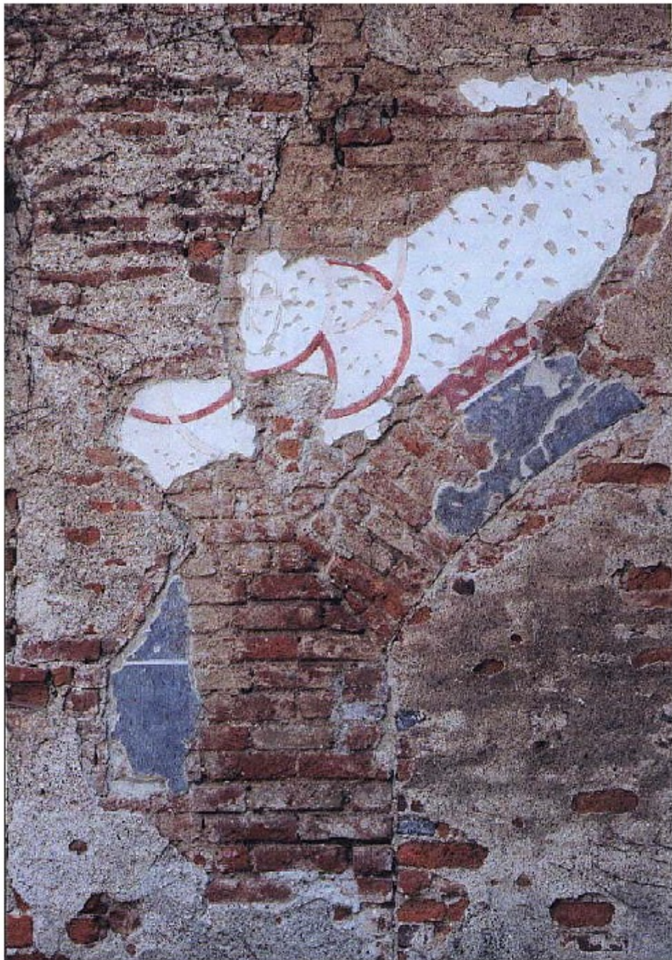
Le tracce rimaste dello stemma della famiglia Rainoldi, antichi proprietari della San Romano