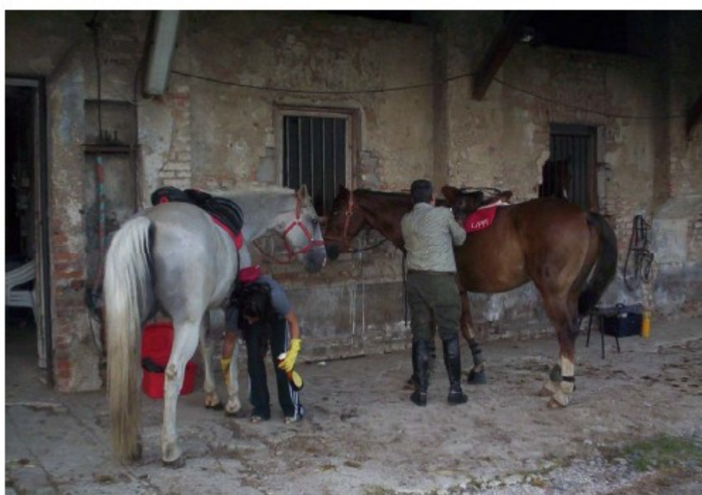
Il rimessaggio dei cavalli