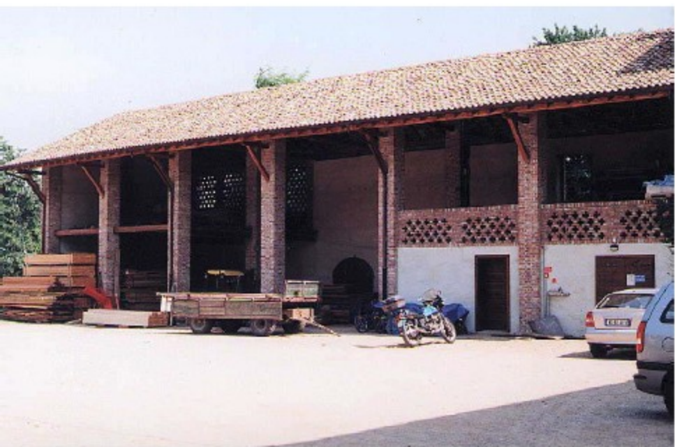
Il nuovo portico, ricostruito a regola d'arte, ora adibito a deposito attrezzi e legname, rimessa macchinari e centrale termica