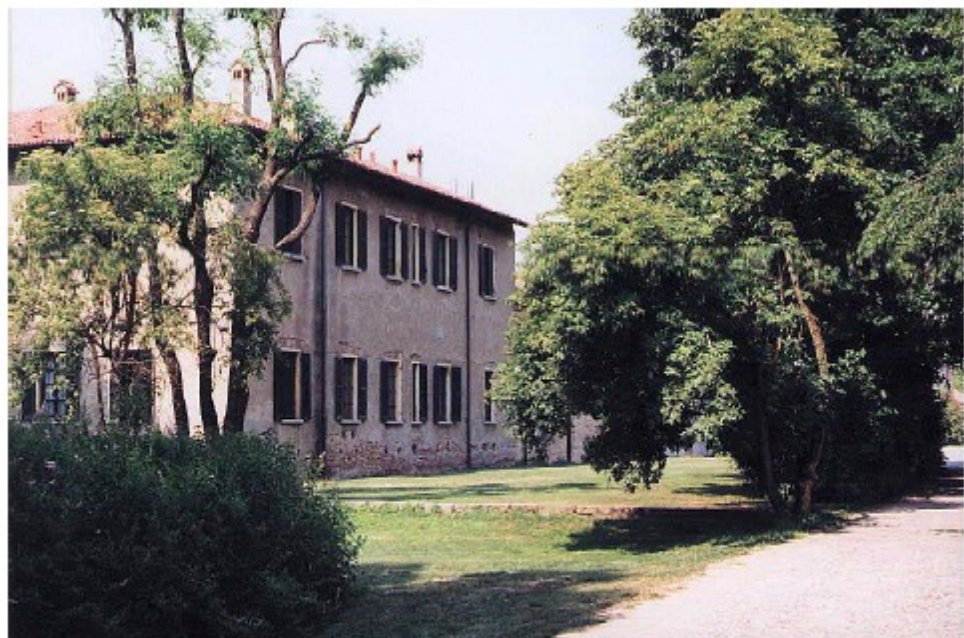
Cascina San Romano – La Foresteria