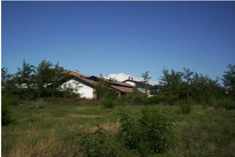
Cascina Bettole vista da sud-ovest