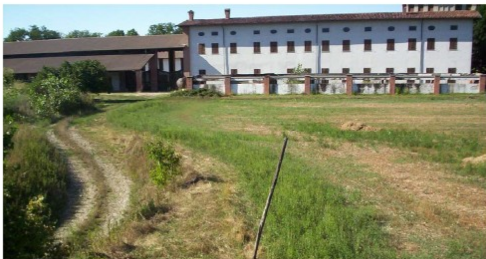
Il complesso di Cascina Bettole visto dal terrapieno della "nuova" Via Novara.

L'importante arteria è stata realizzata ex novo a sud della Cascina a seguito dell'ampliamento dello svincolo con la Tangenziale Ovest in occasione dei Mondiali di Calcio del 1990. Da allora il vecchio tracciato di Via Novara è stato declassato a "strada senza uscita" ed il nuovo, praticamente, "taglia in due" la Cascina con il territorio di competenza.