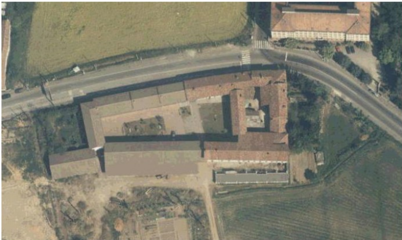
Cascina Bettole prima della realizzazione della “nuova” via Novara e del potenziamento dello svincolo con la Tangenziale Ovest realizzati in occasione dei Mondiali di Calcio del 1990. L’antica locanda si trova sulla destra, in corrispondenza della curva dell’incrocio con via Zanzottera che conduce a Figino.