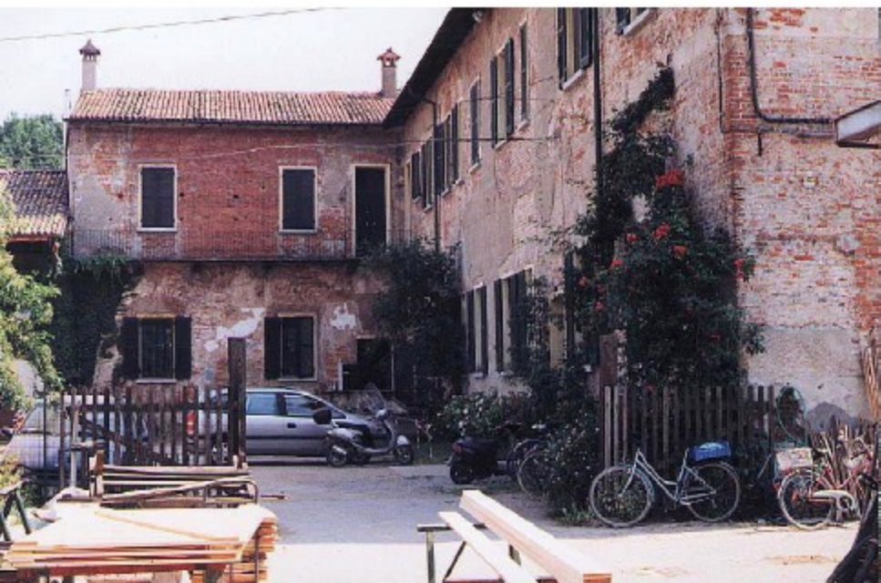
L'ala interna della Foresteria