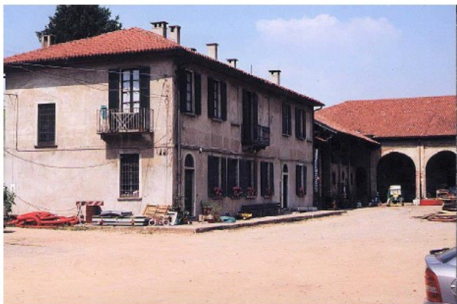
La casa padronale ora trasformata in Direzione, Uffici e Biblioteca del Centro di Forestazione Urbana di Italia Nostra - Boscoincittà