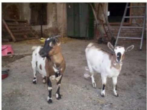
Angela Zamboni ed alcuni simpatici "ospiti" della Cascina