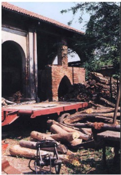
Particolare del portico della stalla