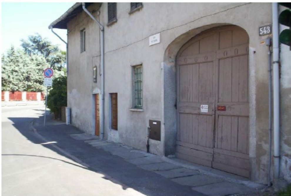
L'antica locanda "Ai Bettol", luogo di sosta per viandanti.