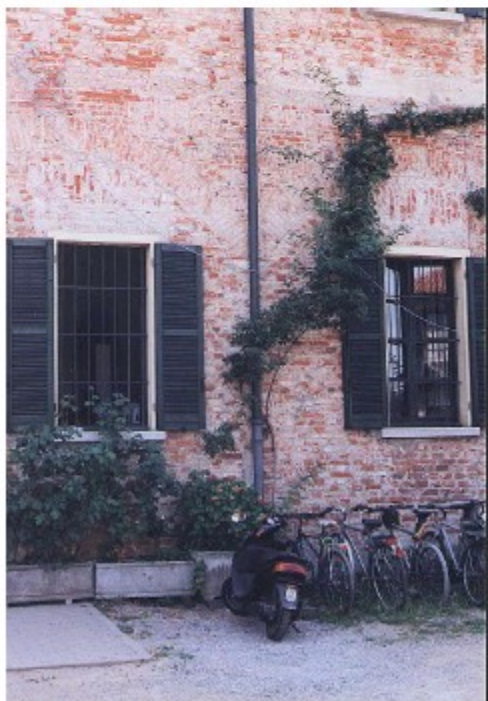
Intreccio di mattoni