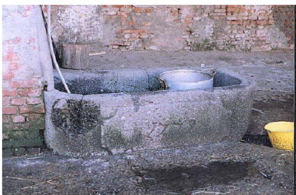
Il lavello in granito utilizzato per abbeverare il bestiame . Al centro la data di realizzazione : 1779, in piena dominazione austriaca.