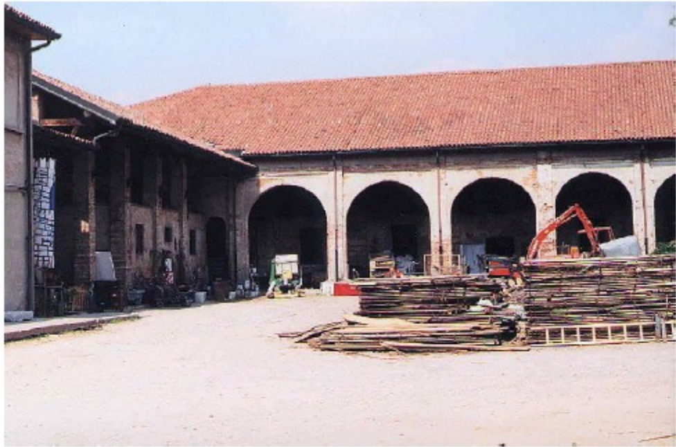
Vista del cortile con il porticato ad archi antistante le ex stalle