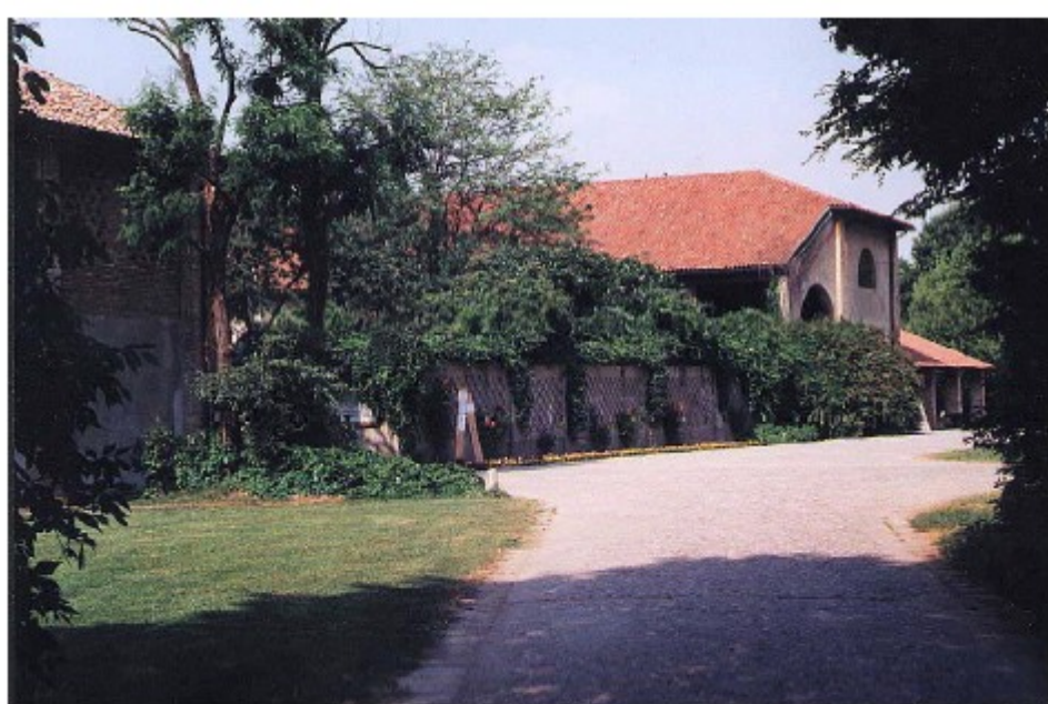
L'ingresso da Via Novara-San Romanello