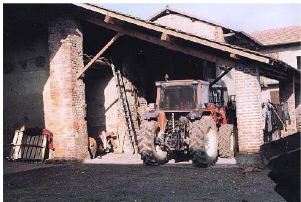
Antico e moderno a confronto