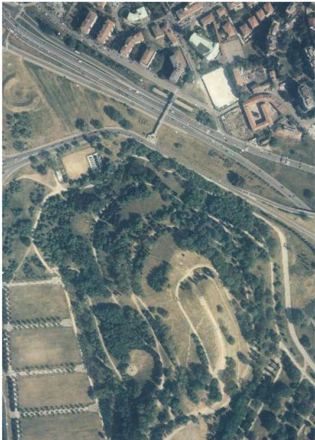
Il Monte Stella, ovvero la "Montagnetta de San Sir" In alto a destra ciò che rimane della Cascina Boldinasco