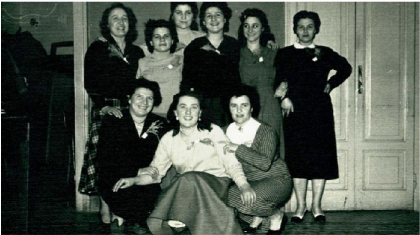
8 marzo 1957 - Un momento di gioia e di serenità in occasione della Festa della Donna alla "Cooperativa Nuova" di Via Carlo Osma a Lampugnano