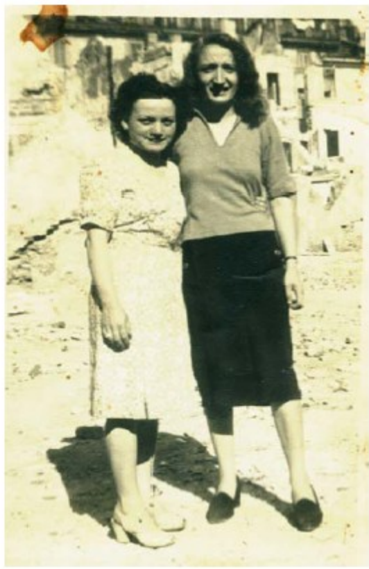
1951 – Due immagini di Cascina Corte Grande colpita dai bombardamenti del 1943. A seguito dei gravi danni riportati, tutto il complesso venne poi demolito.