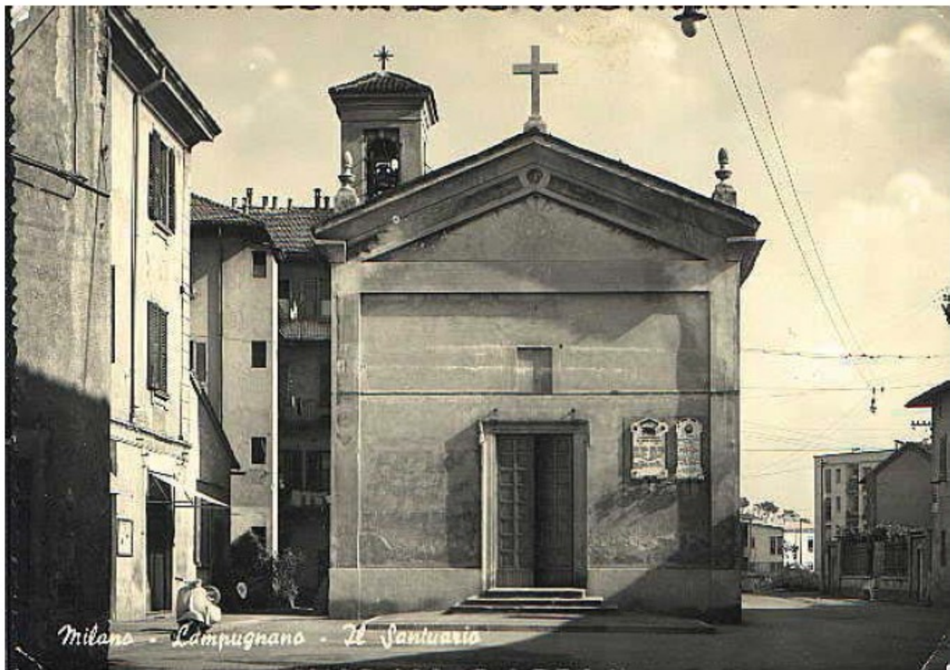
Il Santuario di Lampugnano in un'antica cartolina