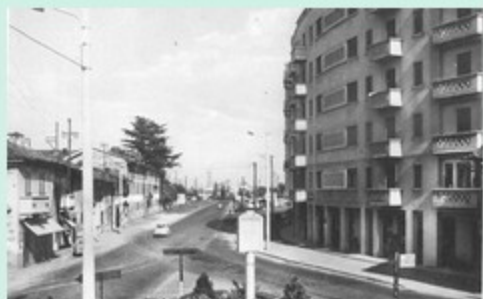
77, 78 - Al Buon Gesù, al castello dei Castellani e Buon Anselmo, la società abbandonava il Seminare per andare a cercare in Bona della via Buon Gesù e la successiva via 20 Settembre. Siamo tornati al 1937. Il nome di via 20 settembre per Milano ha sostituito la precedente viale cittadini del nome. Alle pareti del bar subalterno a sinistra è presente il cartello della rivendita biglietti, rimasto al suo posto sino a pochi anni fa. Un tempo occupare una stanza in comune pubblica in un forno annesso, ripete dell'epoca e già invecchiato in tante altre località (Lombardia, quelle bianche, come a nord di Milano, bianche, come a via di Genova, annesso a bianche di Roma, più una collezione di Spadolini).