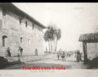
Fine 800 c'era il nulla