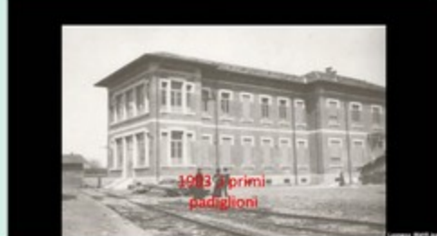
1903 i primi padiglioni