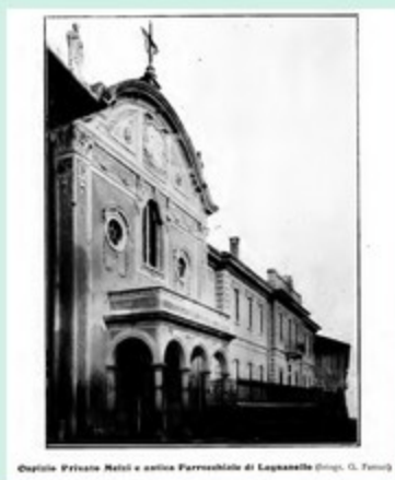
Capitale Privano Melzi e antica Parrocchiale di Legnasette (disegno G. Farnesi)