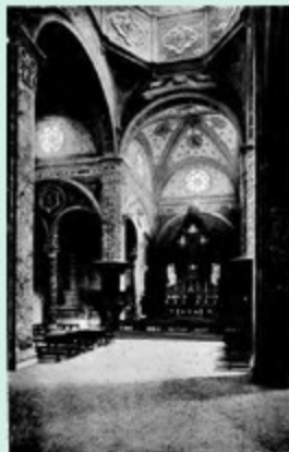
Chiesa Parrocchiale di S. Donato (Interni)