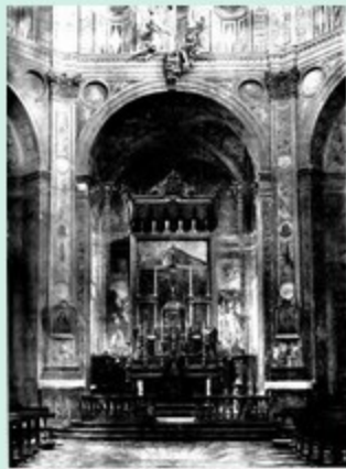
Chiesa monumentale di S. Magno - A. 1992