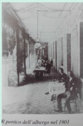
Il portico dell'albergo nel 1901