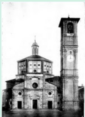
Chiesa monumentale di S. Magno (stato dei restauri alla fine del 1992)