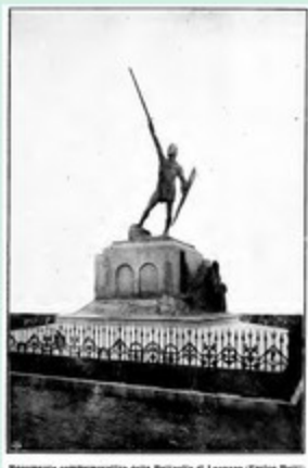
Monumento commemorativo della Battaglia di Legnano (Ettore Biondi)