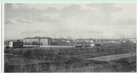
Vigneti alla periferia di Legnano negli anni Trenta.