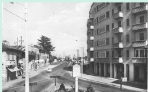
37, 78 - Al Duomo Gesù, al confine tra Castellana e Duomo Arziedo, la società abbandonava il Sempione per girare a sinistra per entrare in Duomo dalla via Duomo Gesù e la succursiva via 20 Settembre. Siamo intorno al 1937. Il tratto è già stato scavato e le cantine sono parzialmente coperte dall'edilizia. Nella destra il nuovo cancello di ferrovia degli otopoli per Milano: ha sostituito le pedonali della cittadina del tram. Alle pareti del bar sottoscrisse a sinistra il perone il cancello della cittadina legnanesi, rimasto al suo posto sino a pochi anni fa. Da tempo scompaiono sotto terra le muraioni pubblici in ferro smaltato, ripiani dell'epoca e già invecchiati in tante altre località (irrimediabili) quelle bianche, rosse e nere di Martini, Bianchi, rosse e Blu di Garcia, rosse e bianche di Romano, più una colorazione Sponada). (77) Coll. Bonazzi, 78-Abel