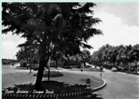
Busto Arsizio - Campo Pirelli