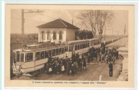
Il treno tramviario speciale che trasporta i regali alla "Giornata"