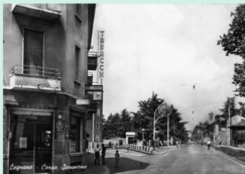
Legnano - Corso Sarmiento