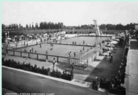
LEGNANO - PISCINA COSTANZO CIANO