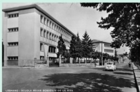
LEGNANO - SCUOLA MEDIA ROSSINI "DE LA RIVA"

UN BILANCIO A LETTERE CAPITALI 2007-2012