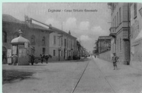
Legnano - Corso Vittorio Emanuele