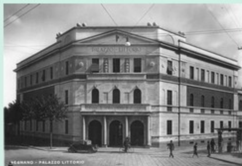
LEGNANO - PALAZZO LITTORIO