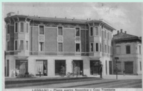
LEGNANO - Piazza quattro Novembre e Casa Trombati