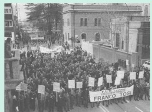
Manifestazione regionale degli elettromeccanici a Legnano, Spezzano lavoratori Franco Tosi, 21 febbraio 1973