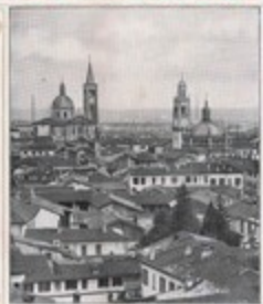
Fantasia 264 - CASA EDITRICE SONZOGNO MILANO - Prezzo Lit. 1,-