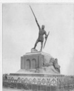
Fantasia 250 - CASA EDITRICE SONZOGNO MILANO - Prezzo Lit. 100.000