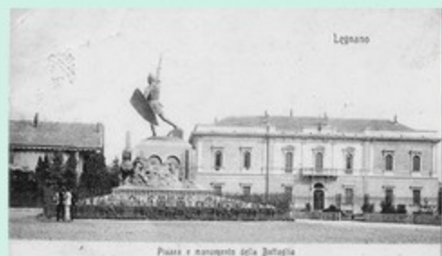
Piazza e monumento della Battaglia