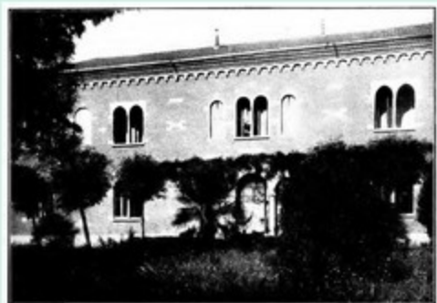
Pallo Salaselle - Facciata verso il giardino (Como) - G. Pizzardi