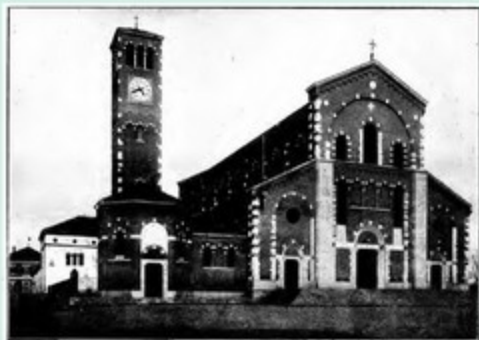
Chiesa Parrocchiale di Luganotte (Como) - G. Pizzardi