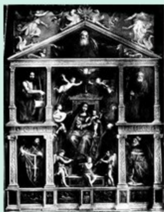
Chiesa monumentale di S. Magno - Palazzo di Aurelio Luffei