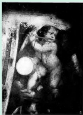
Chiesa monumentale di S. Magno Dettaglio decorativo degli affreschi di Aurelio Luffei