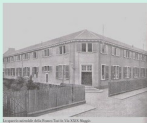
Lo spazio orientale della Franco Tosi in Via XXIX Maggio