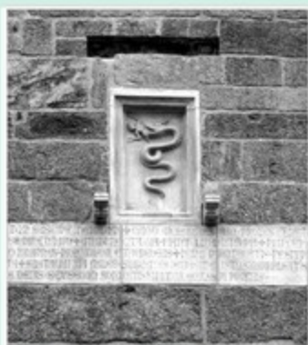
Lo stemma dei Visconti a Milano raffigura un serpente che divora un giovane uomo. Secondo alcuni il serpente sarebbe proprio il mostro del lago Gerundo ucciso da Umberto Visconti nel 1200.