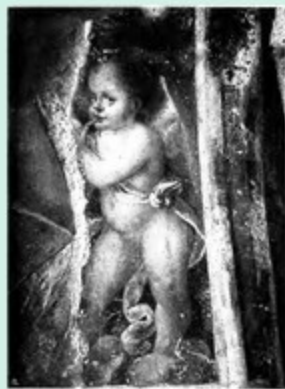
Chiesa monumentale di S. Magno Dettaglio decorativo degli affreschi di Aurelio Lusi