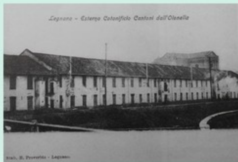
Arch. B. Porro - Legnano