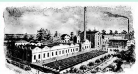
Cotonificio Fratelli Dell'Acqua