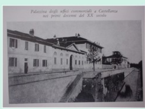
Palazzina degli uffici commerciali a Castellanza nei primi decenni del XX secolo