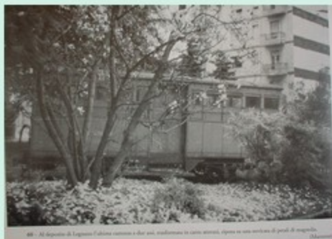
49 - Al deposito di Legnano l'ultima cavalcata a due assi, trasformata in carrozzeria, riposa su una sovrana di panni di maglieria.