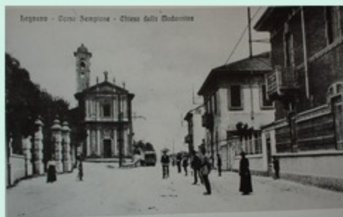
Legnano - Corso Sempione - Chiesa della Madonna