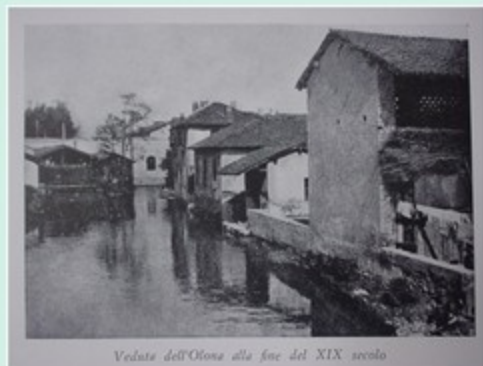
Veduta dell'Olona alla fine del XIX secolo