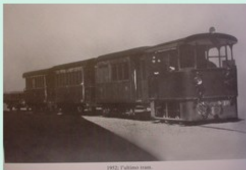
1912, l'ultimo tram.