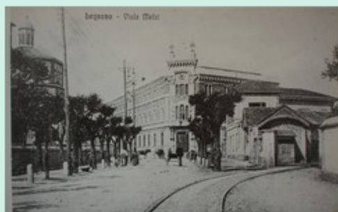
Legnano - Viale Meli

85, 86 - Da viale Meli, che negli anni '30 venne intitolato viale Benito Mussolini, i turisti piangono a destra la sede progettata verso l'edilizia lungo Tosi, al cui angolo era prevista la stazione centrale di Legnano, dotata di madri e di il tempio del sapere, di deposito di carbone per le locomotive. Nella prima immagine, tratta da una cartolina del 1919, sono visibili l'abside della Basilica di San Magno, a sinistra, e il Palazzo Malatesti, sede del Comune, al centro, secondo la presenza di un'isola a trazione animale. Nella seconda un treno a trazione elettrica corre in stazione. Legnano è la seconda metà degli anni '30.