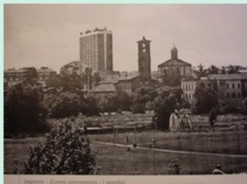
Legnano - Scena panoramica - I giardini.