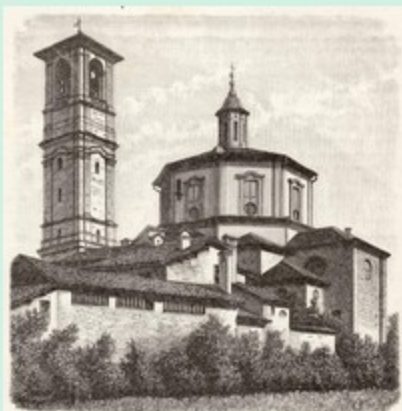
Fig. 108. — Legnano: Chiesa proporzionale di San Rocco.