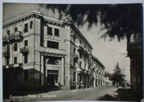
Legnano - Hotel a Colonna