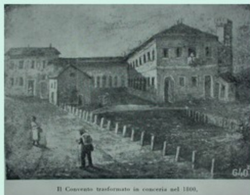
Il Convento trasformato in cinema nel 1880.