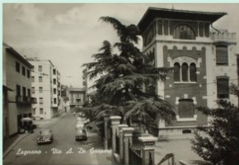
Legnano - Via A. De Gasperi