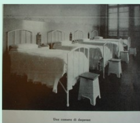
Una camera di degenza