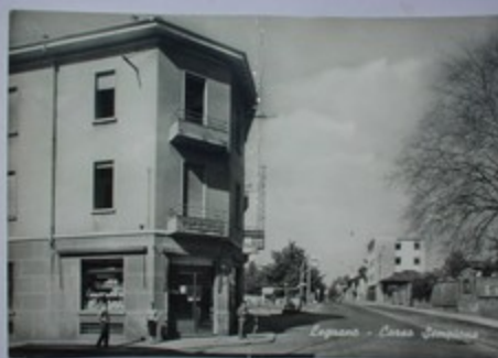
Legnano - Corso Sempione