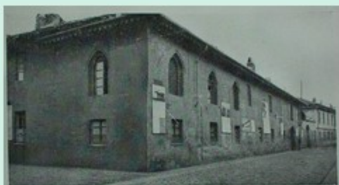
La « Casa dei Pittori Lampugnani » in Via Garibaldi, 18.