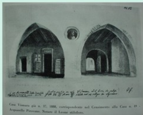
Casa Vimera già n. 37, 1888, corrispondente nel Censimento alla Casa n. 19 - Arquarello Pirovano. Notare il Lesno stiloforo.