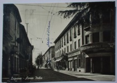
Legnano - Corso Italia