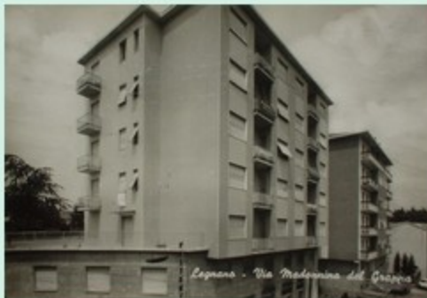
Legnano - Via Madonna del Garzone