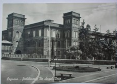
Legnano - Stabilimento Di Ospedale Tross