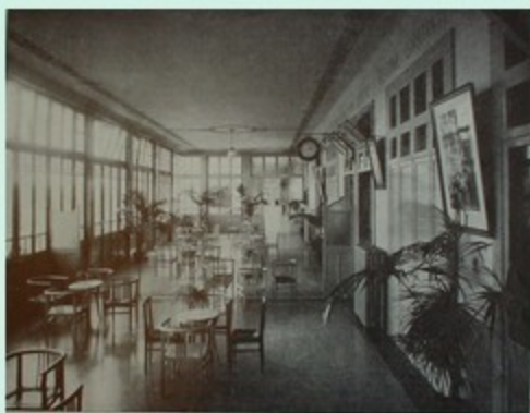
Sala di riunione