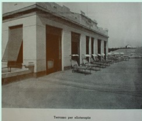
Terrazzo per elioterapia