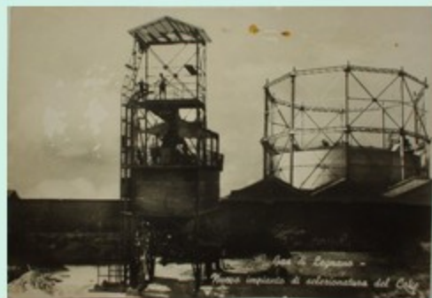
Legnano - Impianto di elettrificazione del C.O.L.