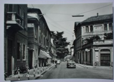
Legnano - Corso