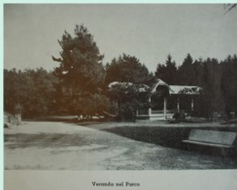
Veranda nel Parco