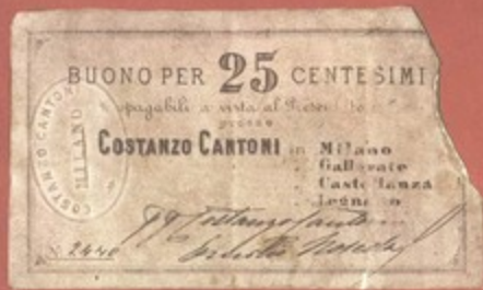
Buoni di pagamento emessi da Costanzo Cantoni (1860 circa)