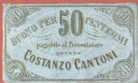
Buoni di pagamento emessi da Costanzo Cantoni (1860 circa)