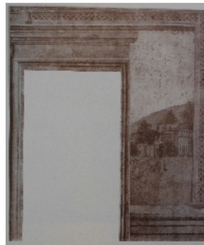
Passaggio affiancante la porta originale