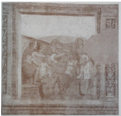
L'imperatore fa torturare un soldato.