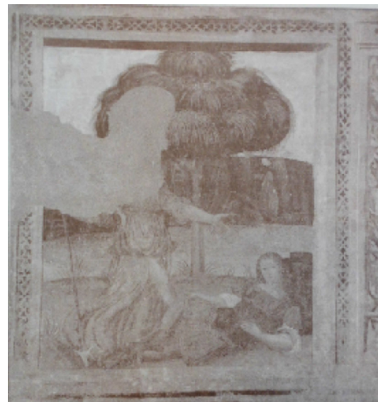
fanciulla che compare in sogni a un soldato.