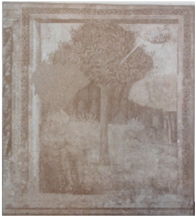
Ninfa in un bosco