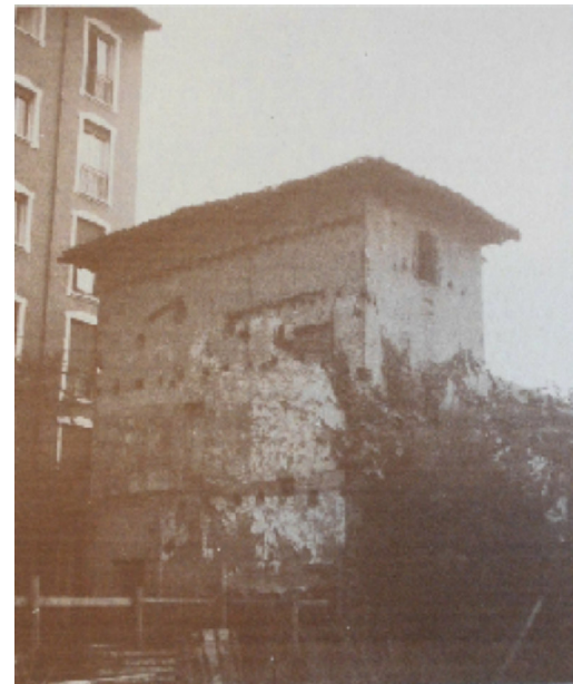
L'edificio prima del restauro