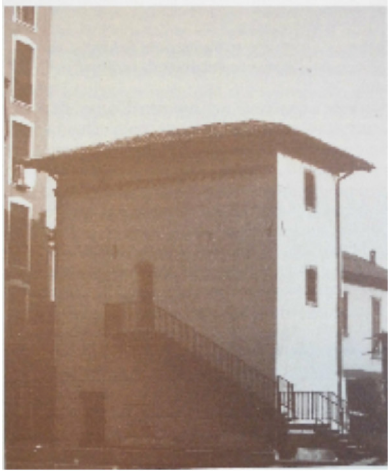
L'edificio dopo il restauro