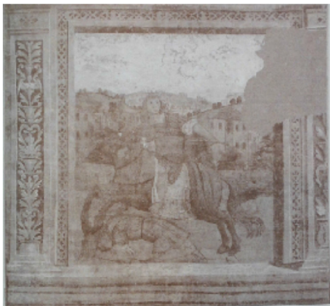
Soldato romano che doma un