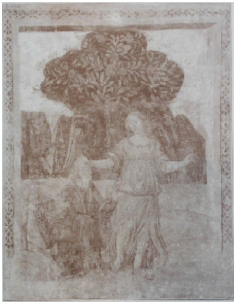
Fanciulla che salva un vecchio