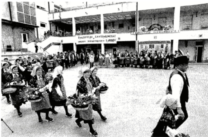
La sfilata dei gruppi folcloristici partecipanti alla rassegna. In primo piano il gruppo dei "Paisan" di Albavilla