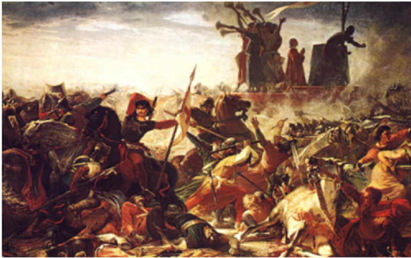
La Battaglia di Legnano