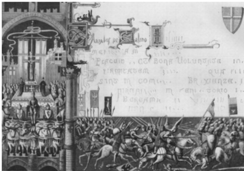
Rarissima incisione tratta da una miniatura medievale inedita

Signore dei Cieli, mite e misericordioso Padre, salva le nostre anime, infondi pietà e dolcezza nella nostra mente, salvaci dalla morte, dalla guerra e da ogni suo orrore.