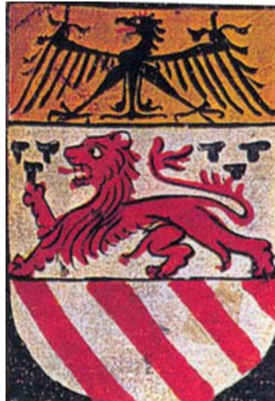
Stemma originale casato Rusca

Tali colori ed emblemi sono tuttora conservati nello stemma gentilizio della famiglia Rusca. Blasonatura: interzato in fascia: al 1° d'oro, all'aquila di nero, al 2° d'argento, al leone di rosso, accompagnato da tre trifogli (o foglie di rusco, comunemente conosciuto come pungitopo) in verde, al 3° bandato di rosso e bianco.