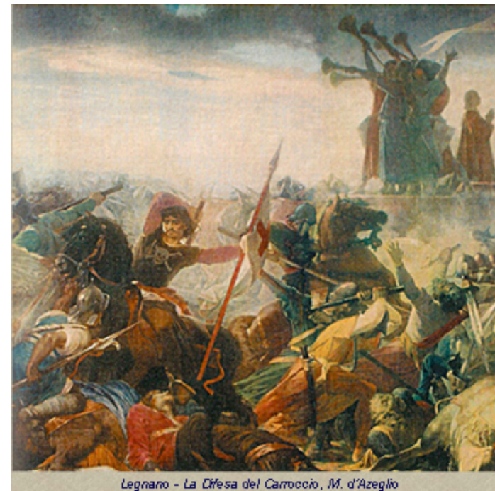
Legnano - La Difesa del Carroccio, M. d'Azeglio

La descrizione dei cronisti lo presenta come un carro a quattro ruote, trainato da tre coppie di buoi e rinforzato sulle fiancate con piastre di ferro. La sua funzionalità era legata alla presenza di una grande cassa a più ripiani, ricoperta di drappi rossi, nella quale era conservato tutto ciò che serviva per medicare i feriti, dagli unguenti alle bende, dagli olii agli sciroppi. Sopra alla cassa si stagliava un'asta, culminante con una croce d'oro dalla quale pendeva un vessillo con una croce rossa, l'immagine di sant'Ambrogio o quella del Signore.