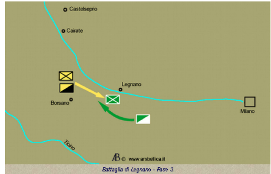
Battaglia di Legnano - Fase 3

L'irruzione di Federico Barbarossa sul campo di battaglia sopra Legnano spostò nuovamente l'equilibrio a favore degli imperiali, provocando infine la rotta degli avversari, che parve decisiva e definitiva. Non a caso, i cavalieri bresciani e milanesi proseguirono la loro fuga ben oltre le postazioni della fanteria intorno al Carroccio a Legnano, prendendo la via per Milano e lasciando i fanti privi della loro copertura; qualcuno, a quanto pare, non si arrestò prima di essere rientrato nelle mura, anche se il cardinal Bosone specifica che almeno alcuni drappelli si fermarono a meno di un chilometro da Legnano. A quel punto comaschi e tedeschi pensarono bene di approfittare dell'apparente debolezza del nemico appiedato e caricarono con tutto l'esercito: «L'imperatore allora, vedendo che i militi lombardi si erano dati alla fuga e che erano rimasti solo dei fanti, sia pure in buon numero, credette di poterli facilmente superare», scrive il contemporaneo arcivescovo di Salerno Romoaldo, forse la fonte migliore sull'episodio.