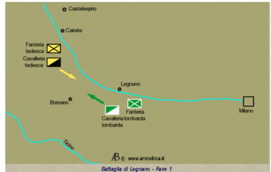
Battaglia di Legnano - Fase 1

Nel borgo di Legnano, distante poco più di venti chilometri dalla città milanese, arrivò per prima la cavalleria bresciana e milanese, dalla quale si staccò un contingente di 700 effettivi con il compito di perlustrare la zona verso Como. Poi a Legnano arrivò anche il Carroccio con parte della fanteria, che si dispose davanti a un fossato, forse costruito per l'occasione alle spalle dei combattenti allo scopo di impedirgli di scappare, in ottemperanza al giuramento della "Compagnia della morte"; ma