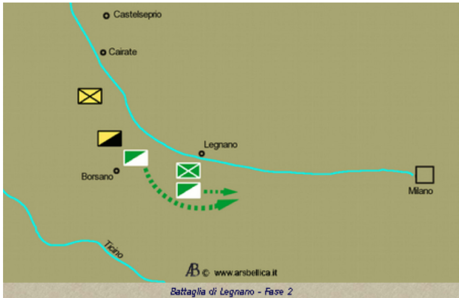
Battaglia di Legnano - Fase 2

L'irruzione di Federico Barbarossa sul campo di battaglia sopra Legnano spostò nuovamente l'equilibrio a favore degli imperiali, provocando infine la rotta degli avversari, che parve decisiva e definitiva. Non a caso, i cavalieri bresciani e milanesi proseguirono la loro fuga ben oltre le postazioni della fanteria intorno al Carroccio a Legnano, prendendo la via per Milano e lasciando i fanti privi della loro copertura; qualcuno, a quanto pare, non si arrestò prima di essere rientrato nelle mura, anche se il cardinal Bosone specifica che almeno alcuni drappelli si fermarono a meno di un chilometro da Legnano. A quel punto comaschi e tedeschi pensarono bene di approfittare dell'apparente debolezza del nemico appiedato e caricarono con tutto l'esercito: «L'imperatore allora, vedendo che i militi lombardi si erano dati alla fuga e che erano rimasti solo dei fanti, sia pure in buon numero, credette di poterli facilmente superare», scrive il contemporaneo arcivescovo di Salerno Romoaldo, forse la fonte migliore sull'episodio.