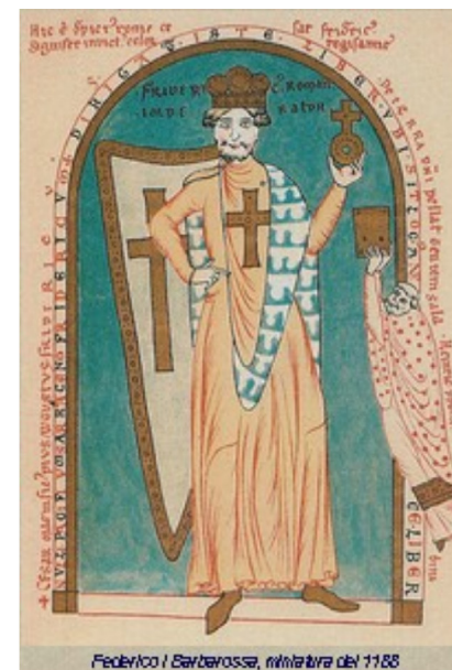
Federico I Barbarossa, miniatura del 1188

Nel 1152 Federico Barbarossa era stato designato alla successione di Corrado III; la scelta fu accolta favorevolmente da tutte parti, sia per le sue qualità personali, sia perchè, essendo egli il figlio di una sorella di Enrico il Superbo e quindi cugino del duca di Baviera Enrico il Leone, sembrava adatto a pacificare e unire nella sua persona le due dinastie rivali. In Federico Barbarossa si realizzò subito un'intesa con la casa guelfa. Allo stesso tempo si ebbe lo spostamento dei confini della lotta dai paesi tedeschi all'Italia e la trasformazione anche interna dei due partiti storici alimentati per parecchio tempo dalle vicende del potere regio imperiale in Germania. Federico Barbarossa, infatti, indirizzò la sua politica verso il ripristino dell'autorità imperiale, in primo luogo nei confronti di quelle istituzioni comunali che, in Italia, avevano già affermato la loro autonomia nei confronti dell'Impero, in questo non ostacolate, se non proprio protette, dalla Chiesa. Agli occhi di Federico Barbarossa, i Comuni erano degli usurpatori dell'unico potere legittimo, quello imperiale.