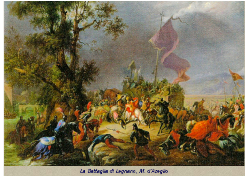
La Battaglia di Legnano, M. d'Azeglio

Per la battaglia di Legnano l'esercito della lega si era organizzato radunando a Milano un numero di effettivi assolutamente imprecisabile, stante l'estrema laconicità delle fonti. Lasciando perdere i numeri paradossali di provenienza imperiale, che vanno da un massimo di 100.000 uomini a un minimo di 12.000, le uniche cifre di cui abbiamo certezza sono quelle fornite da un informato cronista milanese coevo, Sire Raul, che parla della presenza a Legnano di 50 cavalieri di Lodi, 200 di Piacenza e 300 di Vercelli, cui andrebbero sommati almeno 900 cavalieri milanesi. A questi numeri vanno aggiunti gli altri contingenti di cavalleria forniti da città come Verona, Brescia e Novara, e dall'intera Marca Trevigiana, oltre a un adeguato numero di fanti, tre o quattro migliaia, permettendoci di immaginare a Legnano un'armata non più grande di qualche migliaio di effettivi.